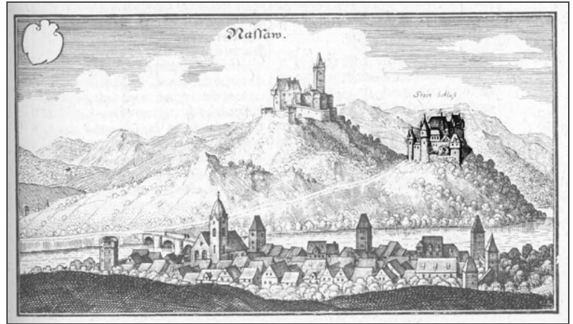
Merian Stich von Nassau mit Burg Nassau und Burg Stein, um 1655.

Klicken Sie in das jeweilige Bild, um es in voller Größe ansehen zu können!