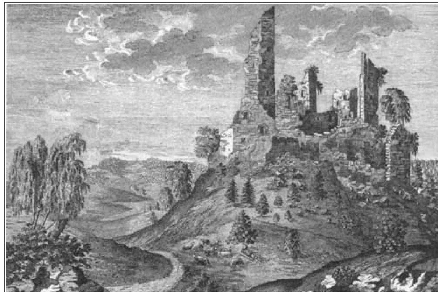
Klicken Sie in das Bild, um es in voller Größe ansehen zu können!

Informationen für Besucher | Bilder | Grundriss | Historie | Literatur | Links