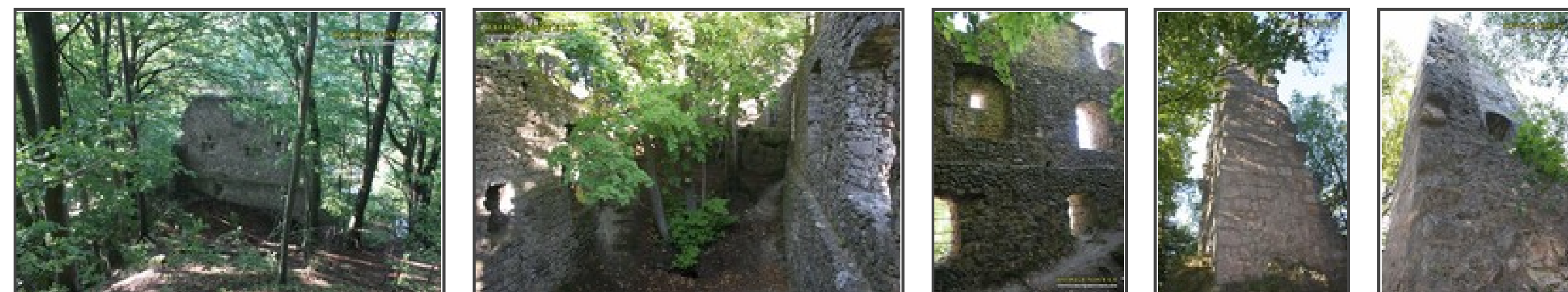
Klicken Sie in das jeweilige Bild, um es in voller Größe ansehen zu können!