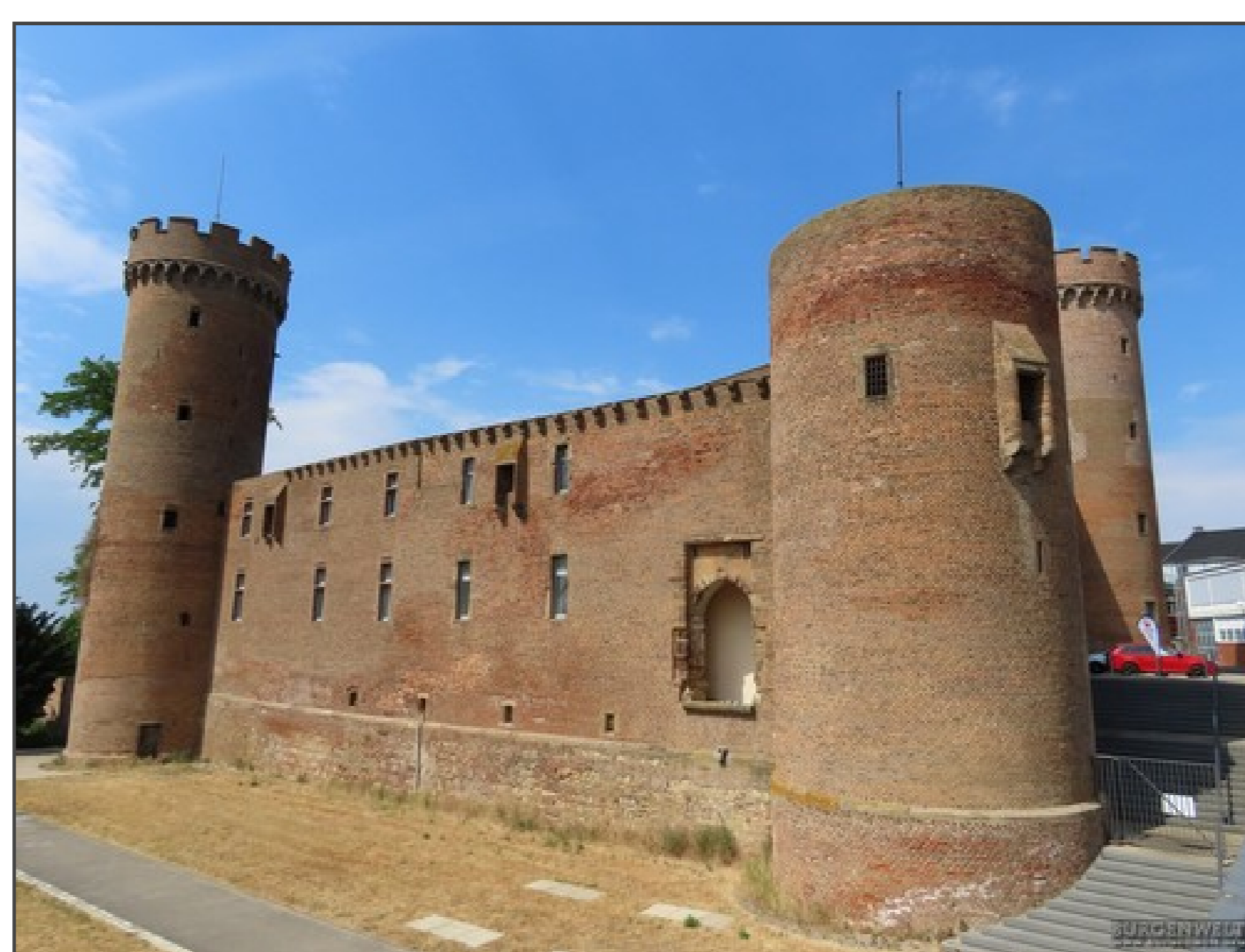
Klicken Sie in das Bild, um es in voller Größe ansehen zu können!

Informationen für Besucher | Bilder | Grundriss | Historie | Literatur | Links