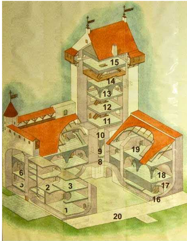
Querschnitt der Hauptburg