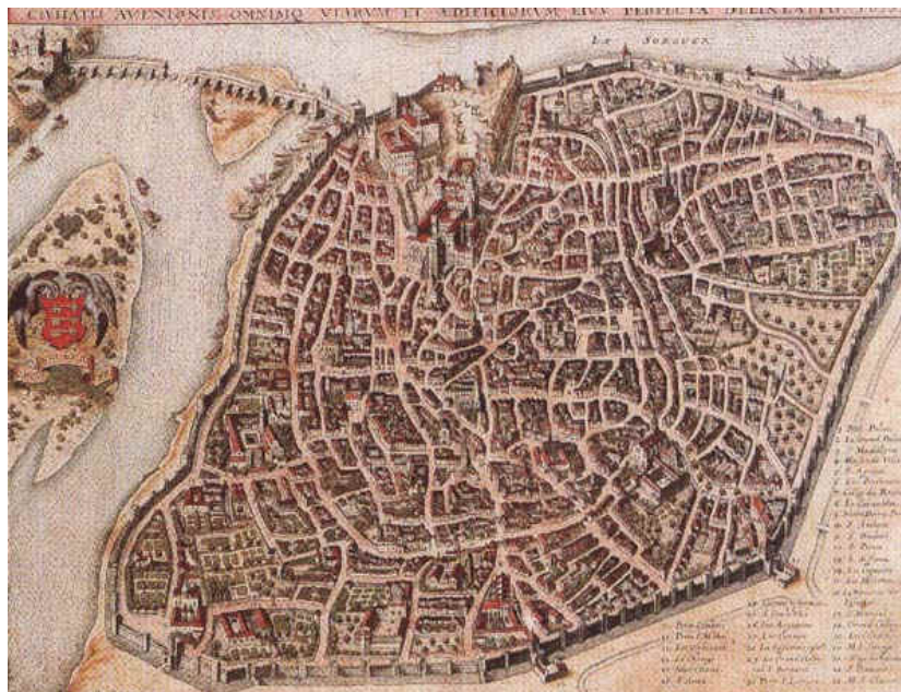
Stadtplan von 1635 (gezeichnet von Mérian).