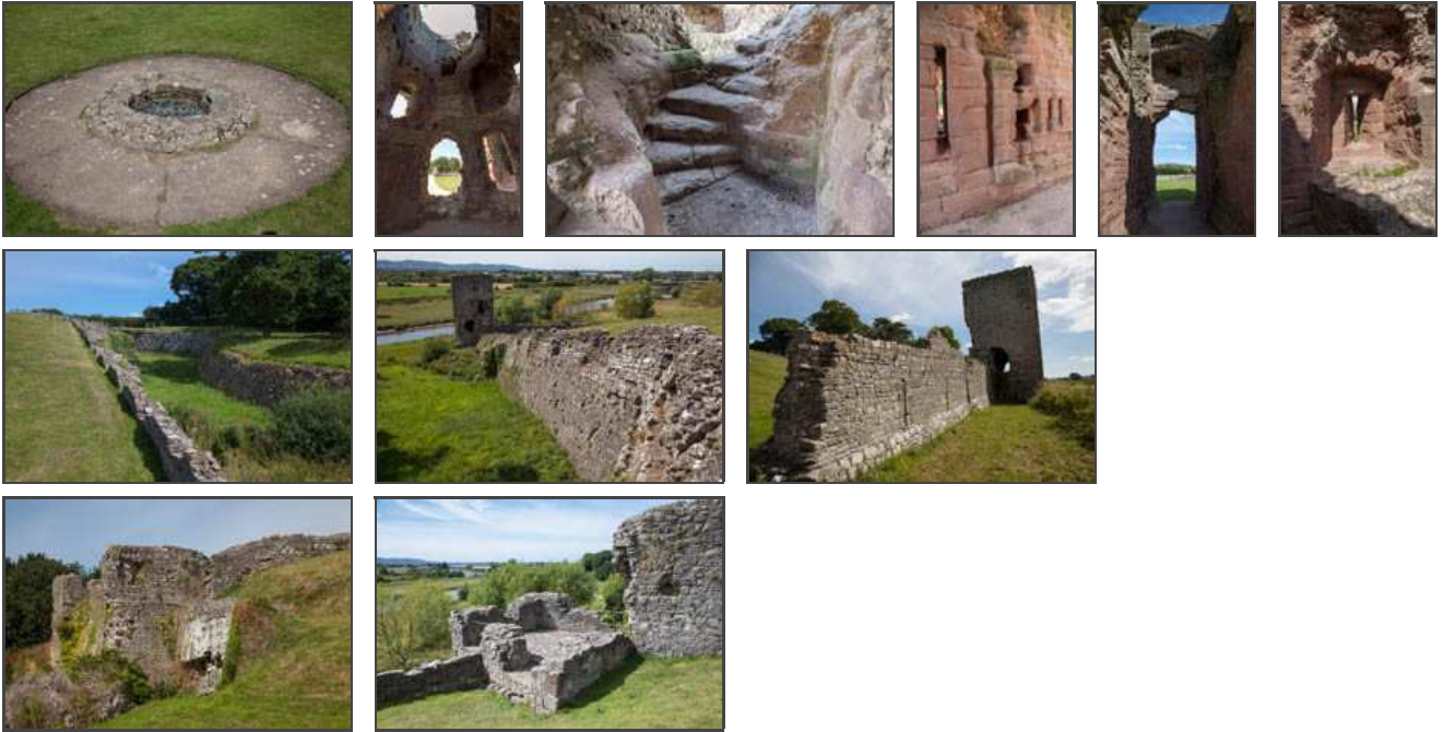
Klicken Sie in das jeweilige Bild, um es in voller Größe ansehen zu können!