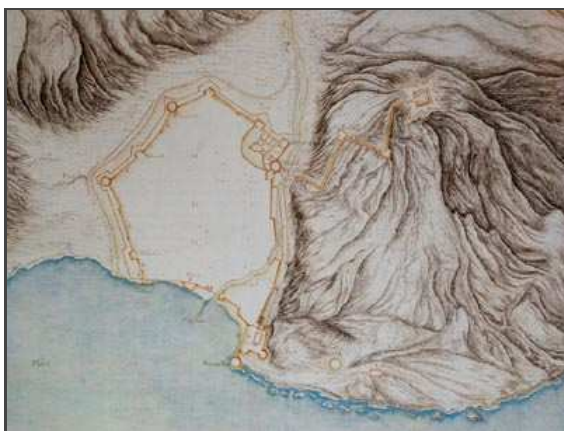
Grundriss der Stadt und der benachbarten Tvrđava Nehaj ; nach Martin Stier, 17. Jh.

Klicken Sie in die Bilder, um sie in voller Größe ansehen zu können!