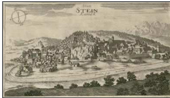
Quelle: Johann Weichart von Valvasor - Topographia Ducatus Carnioliae | 1679.

Informationen für Besucher | Bilder | Grundriss | Historie | Literatur | Links