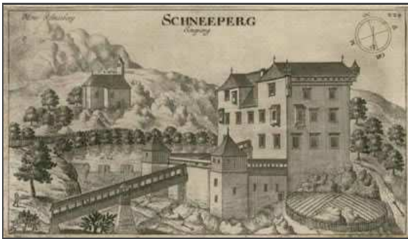
Quelle: Johann Weichard von Valvasor - Die Ehre dess Hertzogthums Crain | Laibach, 1689.

Informationen für Besucher | Bilder | Grundriss | Historie | Literatur | Links