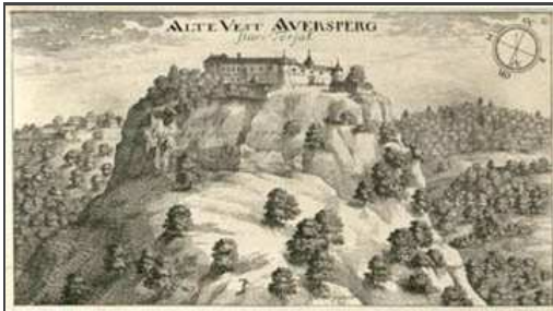
Quelle: Johann Weichard von Valvasor - Topographia Ducatus Carnioliae modernae ... | 1679.

Informationen für Besucher | Bilder | Grundriss | Historie | Literatur | Links