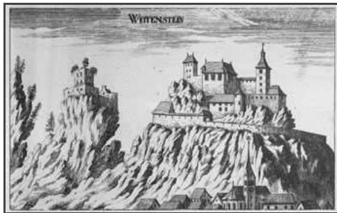
Quelle: Vischer, Georg Matthäus - Topographia Ducatus Stiriae | Graz, 1681.

Informationen für Besucher | Bilder | Grundriss | Historie | Literatur | Links